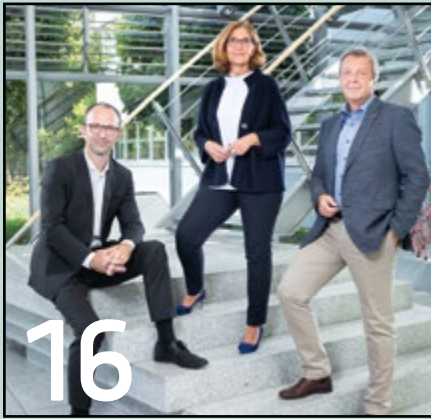
Lamy: Expansion schreitet voran