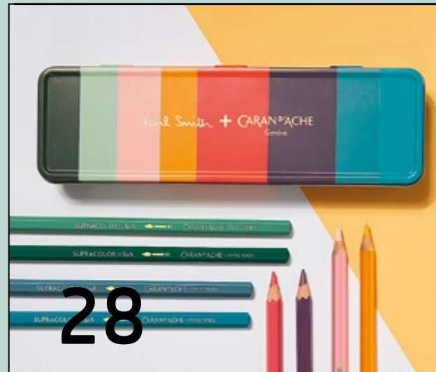
Caran d'Ache: Gestreiftes Farbenspiel