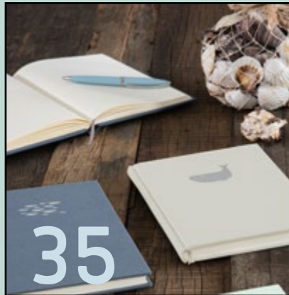
Semikolon: Neue Edition für guten Zweck