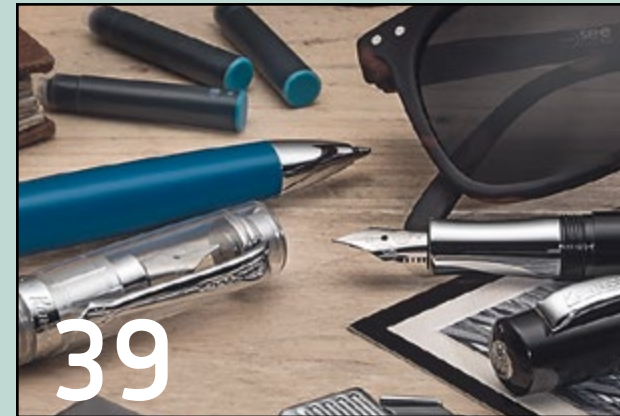
Kaweco: Nostalgischer Blick in die Vergangenheit