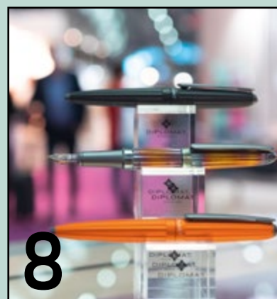
Paperworld: Starke Produkte für die neue Saison