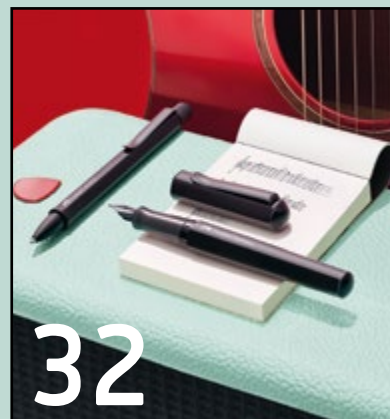
Faber-Castell: Neue Lust auf Handschrift